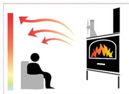
Warmte verdeling met kachelventilator