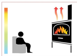
Warmte verdeling zonder kachelventilator

U kunt onze kachelventilator direct gebruiken zonder ingewikkelde montage-instructies. Zodra de bovenplaat van uw kachel de vereiste minimumtemperatuur heeft bereikt beginnen de propellers automatisch te draaien. U hoeft de kachelventilator niet aan te zetten, deze werkt compleet zelfstandig zonder externe energiebron. Uit de verpakking, op de kachel en de kachelventilator doet zijn werk!